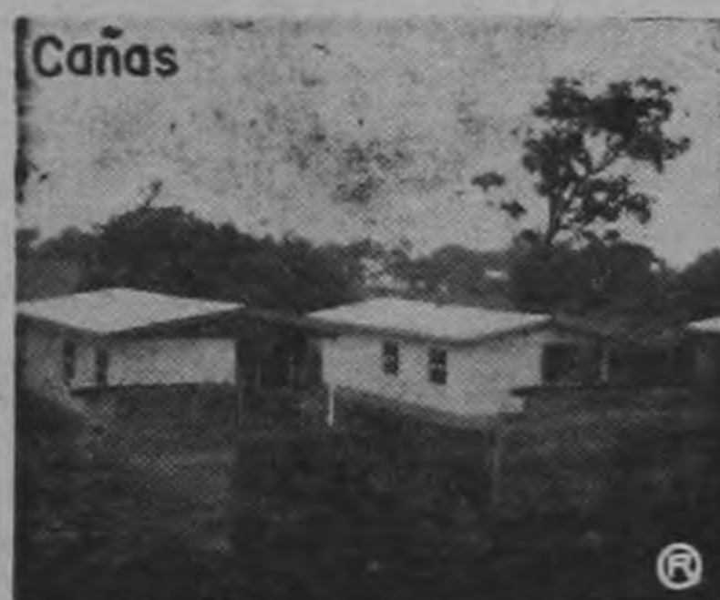
EJEMPLOS DE VIVIENDA PARA DAMNIFICADOS

ADEMAS EL I.N.V.U. HA EFECTUADO 57 OPERACIONES HIPOTECARIAS, E INICIARA PROGRAMAS ANTES DE FINALIZAR ESTE AÑO EN: