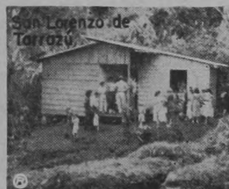
EJEMPLOS DE VIVIENDA RURAL