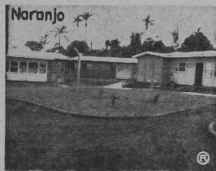
EJEMPLOS DE VIVIENDA URBANA