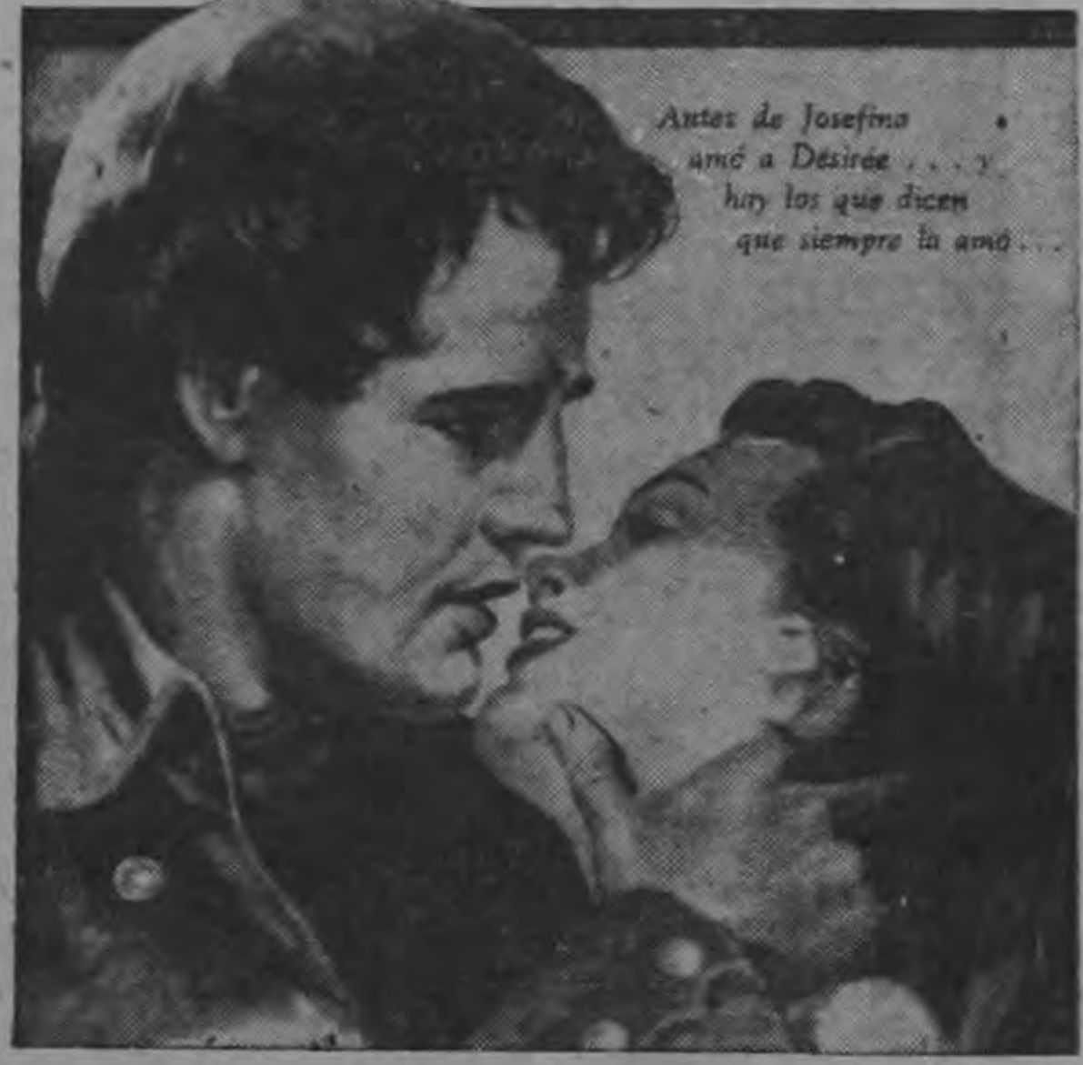
Antes de Josefine amó a Désirée... hay los que dicen que siempre la amó...

MARLON BRANDO, en la suprema interpretación para la pantalla como NAPOLEON BONAPARTE. La encantadora JEAN SIMMONS, MERLE OBERON y MICHAEL RENNIE en el titán.