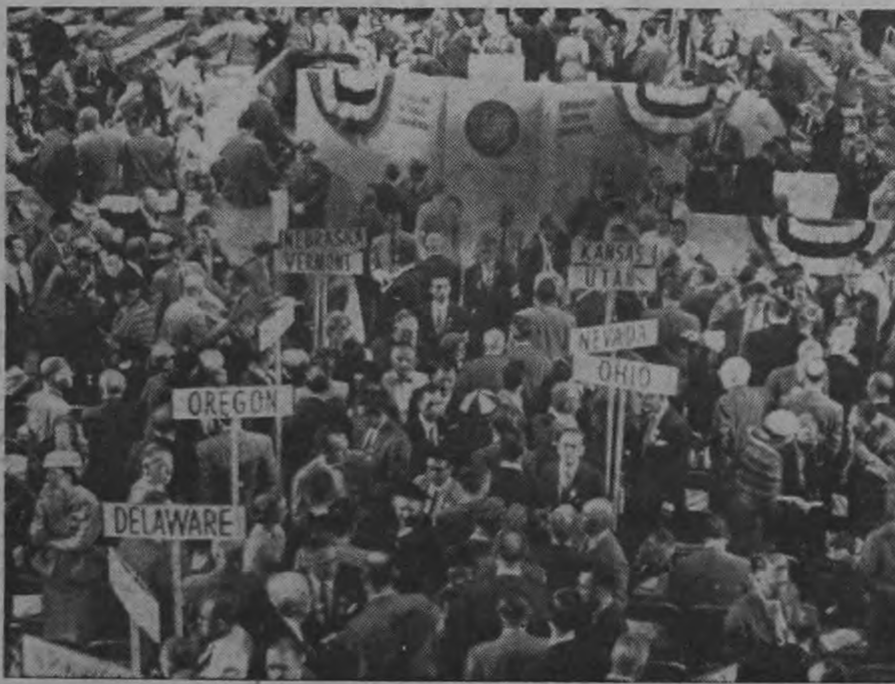
He aquí una vista general del Cow Palace en San Francisco, cuando el Gobernador del estado de Washington, Arthur B. Langlie (en la tribuna,) pronunciaba el discurso principal en la Convención Nacional Republicana.